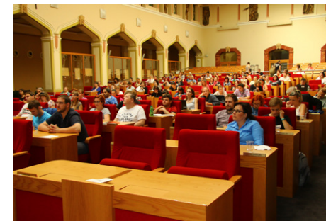
Jednalo se o dvoudenní

Zúčastnili jsme se konference, kterou pořádala Armáda spásy a Husitská teologická fakulta UK v Praze.