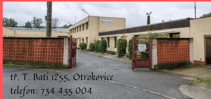
tř. T. Bati 1255, Otrokovice telefon: 734 435 004

Ti dlužníci, kteří neměli na úhradu exekuce, spadající do Milostivého léta II, navíc díky navázané spolupráci nejen měli možnost řešit své dluhy, ale někteří se zbavili skutečně všech dluhů.