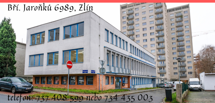
telefon: 737 408 599 nebo 734 435 003

V dalším roce 2023 se chystá třetí Milostivé léto, avšak bude odlišné a pravděpodobně se nebude týkat stejných věřitelů jako dosud. Podrobnosti prozatím řeší zákonodárci.