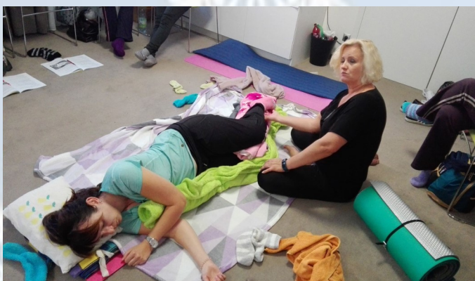
Kurz bazální stimulace