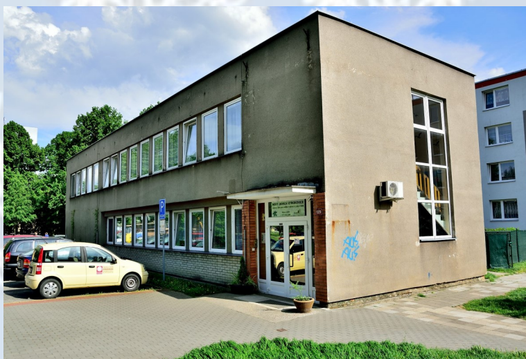
Den na Novém domově