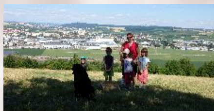
Letní posezení klientů Charitního domova