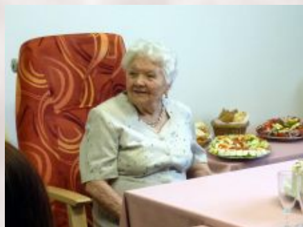
Společná akce rodin Terénní služby nedaleko Otrokovic